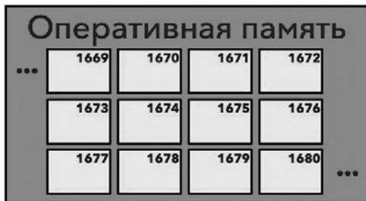
Рис. 4.2. Память с набором ячеек

Рассмотрим принцип работы оперативной памяти. На рис. 4.2 приведен схематичный вид памяти с ячейками № 1669–1680. В настоящее время эти ячейки пусты, то есть не имеют записанной в них информации.