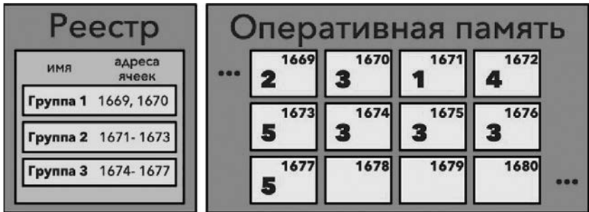
Рис. 4.4. Результат умножения двух чисел помещен в новое хранилище

В листинге 4.1 указателем на то, что необходимо произвести операцию умножения, служит оператор * (умножение). В результате выполнения выражения будет получено новое значение 3335, записанное в группу ячеек с именем «Группа 3» (рис. 4.4).