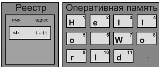
Рис. 4.7. Результат создания нового хранилища данных

Если представить текущую схему оперативной памяти, то она выглядит так, как показано на рис. 4.7.