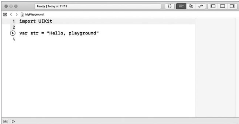
Рис. 4.5. Окно нового playground

ПРИМЕЧАНИЕ Если вы закрыли предыдущий playground-проект, то создайте новый. Для этого откройте Xcode, в появившемся меню выберите пункт «Get started with a playground», после чего выберите Blank и укажите произвольное название нового проекта. Перед вами откроется рабочее окно Xcode playground (рис. 4.5).